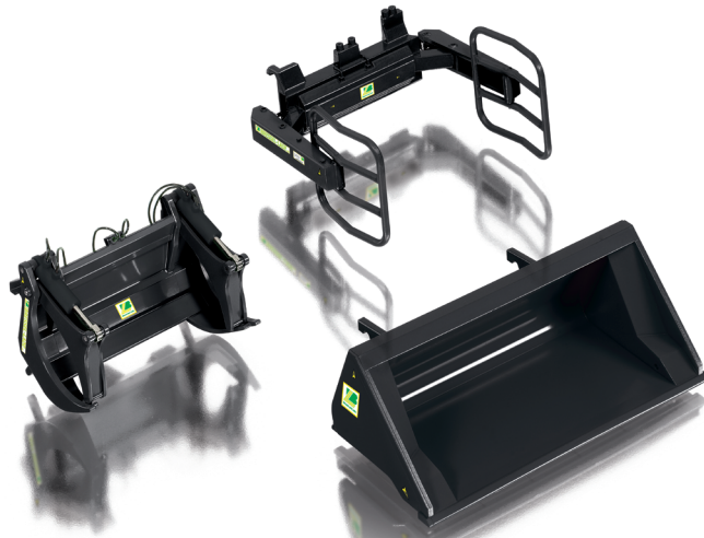
0773 85 Frontlader Werkzeuge - Set A