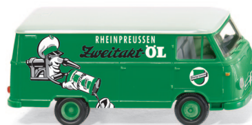
0270 47 Borgward Kastenwagen B611 UVP 12,49 €