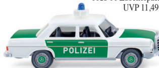
0864 24 Polizei - MB 200/8 UVP 12,99 €