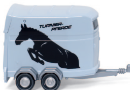
0066 04 Pferdeanhänger UVP 7,99 €