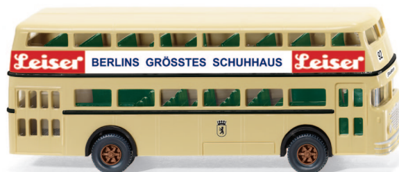
0722 03 Doppeldeckerbus D2U (Büssing) UVP 17,99 €

Youngtimer und bewährte Klassiker führt WIKING gelungen zusammen: Besonders die legendäre Parkhalle dürfen die Markenenthusiasten einmal mehr in ihre Sammlung historischer WIKING-Modelle einreihen. Nur wenige Jahre war einst das Fertigmodell aus dem Zubehörprogramm der Traditionsmodellbauer erhältlich, ehe seine Formen für Jahrzehnte im Archiv verschwanden. Unterdessen gibt sich der BMW