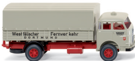
0416 01 Pritschen-Lkw (MAN Pausbacke) UVP 14,49 €