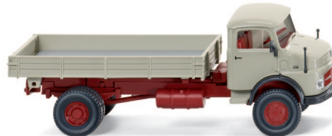
0895 04 Pritschenkipper (MB LAK 710) UVP 13,99 €