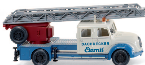
0862 35 Hebebühnenwagen (Magirus) UVP 20,99 €