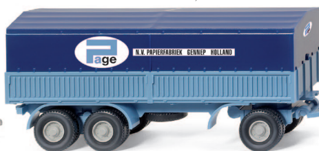
0410 01 Stahlpritschenhängerzug (MB LP 1620) UVP 19,99 €