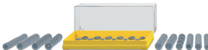
0018 06 Zubehörpackung - Räder UVP 11,49 €