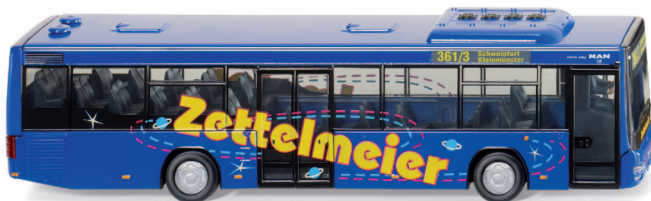
0707 02 MAN Lion's City A78 UVP 23,99 €