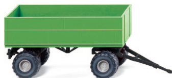
0388 39 Landwirtschaftlicher Anhänger UVP 5,99 €