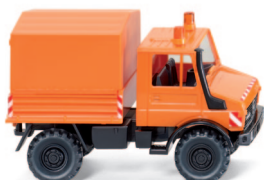
0374 02 Unimog U 1700 - Kommunaldienst UVP 11,49 €