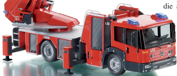
0431 01 Feuerwehr - DL 32 (MB Eonic)

D iecast-Qualität in 1:43 – WIKING stellt mit der Oktober-Auslieferung gleich zwei Feuerwehr-Spezialisten vor, die mit Funktionalität und Detailkraft überzeugen. Mit der DL 32 von Metz fährt erstmals eine Drehleiter ins Programm, die angesichts ihrer Dimension auf den ersten Blick beeindruckt. Die volle Beweglichkeit des 75 cm langen Leiterparks auch in der 43-fachen Miniaturisierung steht dabei im Mittelpunkt dieser neuesten Drehleitergeneration, die auf dem Fahrgestell des Mercedes Benz Eonic eine imposante Einsatzwirkung entfaltet. Als Pendant dazu stellt WIKING die neue „AT“-Generation von