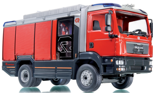
0431 40 Rosenbauer AT (MAN TGM)